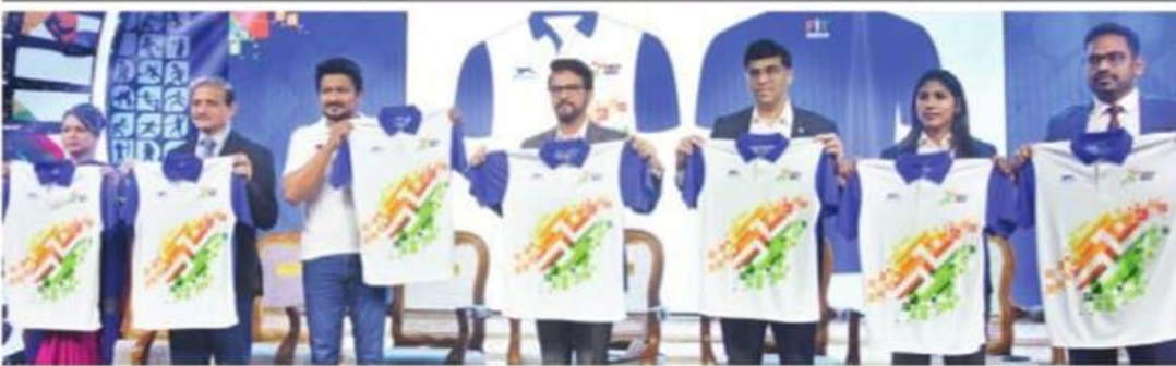
சென்னையில் இளைஞர் நலன் மற்றும் விளையாட்டு மேம்பாட்டுத் துறை, தமிழ்நாடு விளையாட்டு மேம்பாட்டு ஆணையம் ஆகியவை சார்பில் ஜூன் 19-ஆம் தேதி தொடங்கவுள்ள ‘கேலோ இந்தியா’ விளையாட்டுப் போட்டிக்கான பிரத்யேக உடையை வெளியிட்ட மத்திய அமைச்சர் அனூராக் தாக்குர், அமைச்சர் உதயநிதி ஸ்டாலின்.