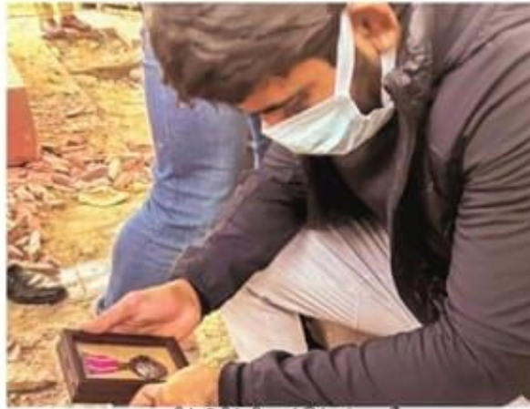
புது தில்லியில் பிரதமர் இல்லம் அருகே பத்மஸ்ரீ விருதைக் கைவிட வந்த மல்யுத்த வீரர் பஜ்ரங் புனியா.

40 நாங்கள் கடந்த நிலையில் போராட்டத்தை தொடர முடிவாக வளைவில் எங்களுக்கான நெருக்கடி அதிகரித்தது. அடுத்து என்ன செய்வது எனத் தெரிவாத நிலையில்,